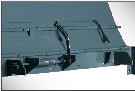
Exclusivo soporte de cuatro escuadras de refuerzo de McGuire en posición de almacenamiento y de carga final.