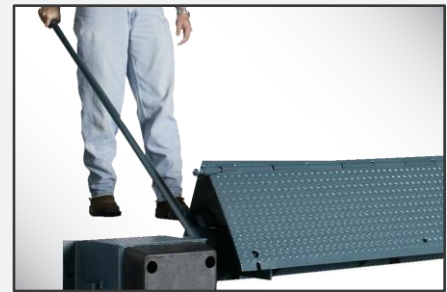
La acción de palanca "sin levantamiento" de McGuire significa que no hay que plegar, levantar o tirar del nivelador.